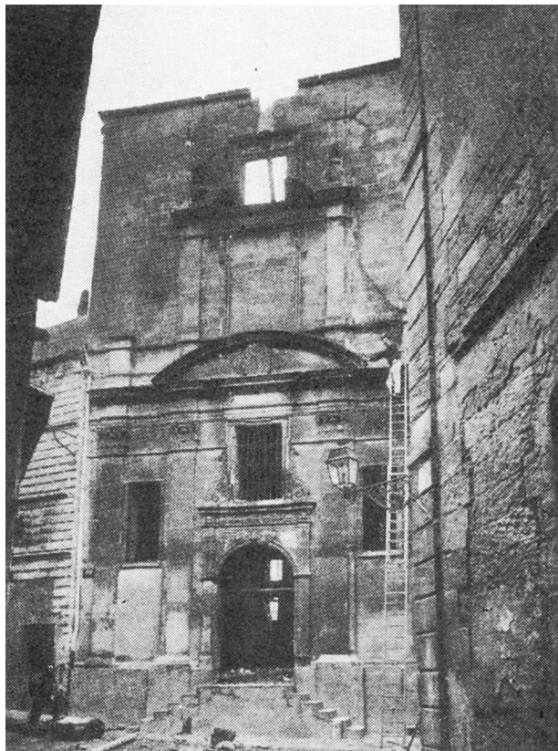
L' église sur une photographie ancienne

Texte de Jean Boyer, extrait du Bulletin des Amis du Vieil Arles , n°77, décembre 1991.